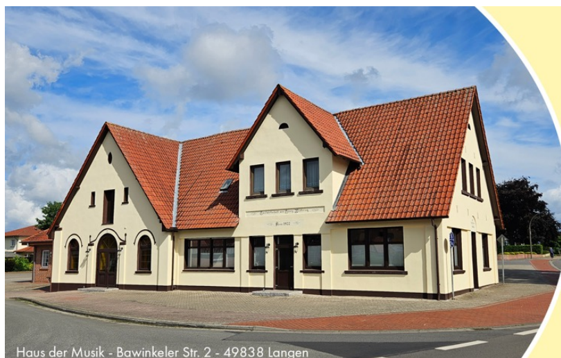
Haus der Musik - Bawinkeler Str. 2 - 49838 Langen

Interessierte Vereine und Ensembles, die ein Probenwochenende im Haus der Musik durchführen möchten, können sich gerne für weitere Informationen und Anfragen melden. www.hausdermusiklangen.de