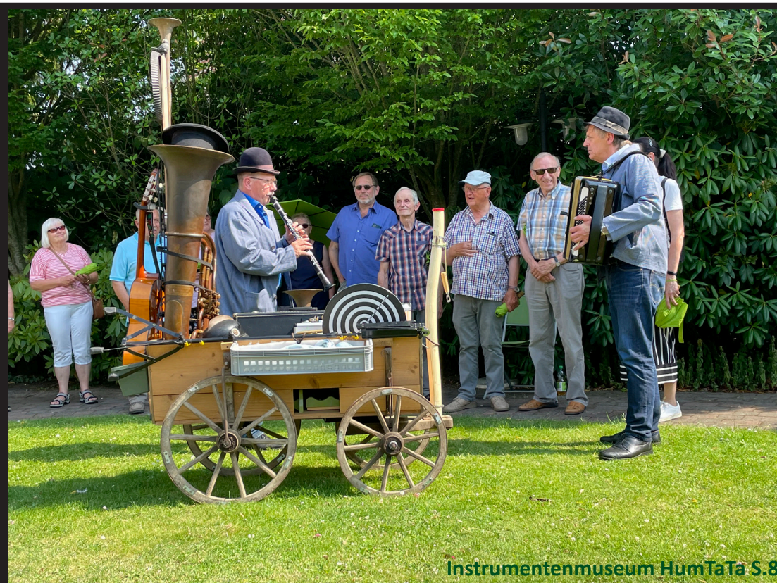
Instrumentenmuseum HumTaTa S.8

Schon 2020 hatte sich der Vorstand des RMV Emsland/Grafschaft Bentheim vorgenommen dieses Projekt durchzuführen. Doch dann kam Corona. Dieses Jahr war es dann so weit. S.9