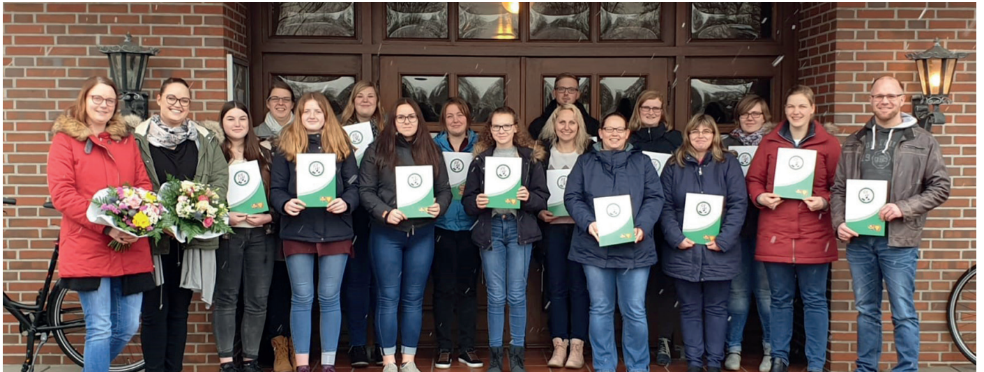
Im Februar 2019 nahmen die Papenburger stolz ihre Urkunden und Anstecknadeln entgegen.

B eim Spielmannszug Papenburg standen im letzten Jahr einige Veränderungen an.